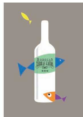
↑ Cartel de Taber Calderón, ganador del certamen en 2008 / Poster by Taber Calderón, winner of the 2008 competition