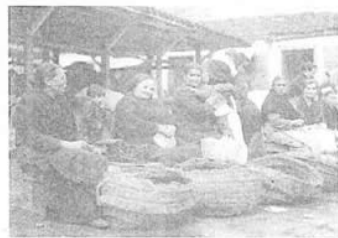
Mercado, vendedoras de castañas. A Coruña, 8 decembro 1925